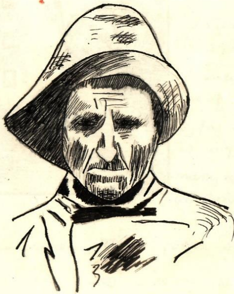
Prybak z Hlelu.